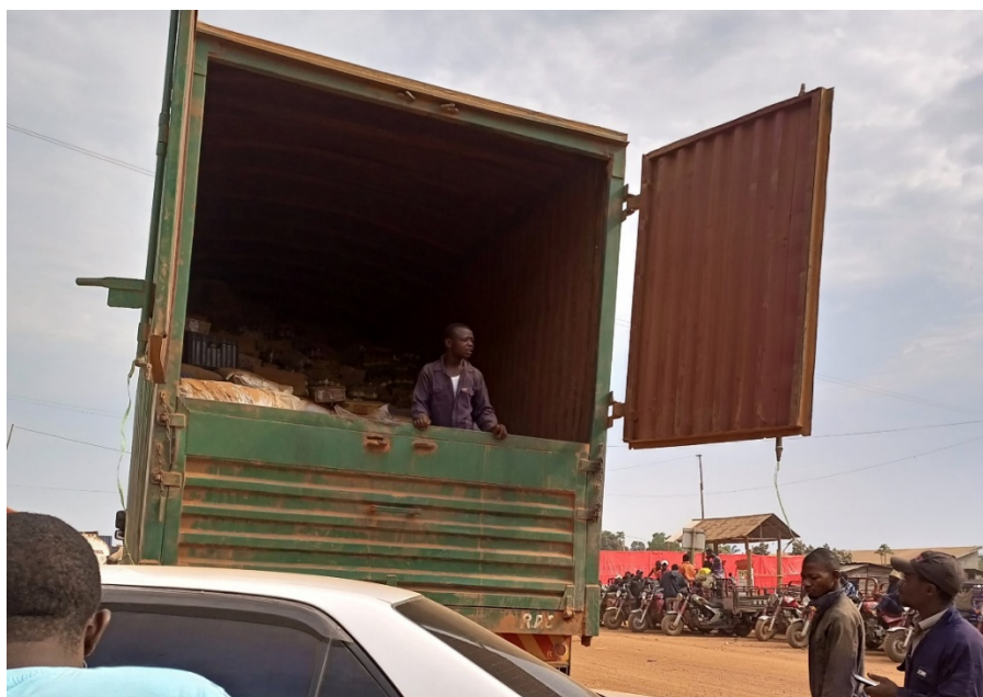
Image 8. Camion des marchandises en déchargement à Mambasa en provenance de Butembo. Camion appartenant à un important commerçant Nande de Mambasa.

Ensuite, le territoire de Mambasa est un carrefour économique et une voie obligée vers d'autres destinations commerciales . En fait, pour les commerçants Nande, la position de Mambasa est très stratégique, car elle est au cœur de trois provinces (Nord-Kivu, Haut-Uélé, Tshopo, Ituri). A partir de Mambasa, on sait aller dans la ville d'Isiro (Haut-Uélé) et de là vers Buta (Bas-Uélé). À partir de Mambasa on sait également aller vers Bunia (chef-lieu de l'Ituri). À partir de Mambasa on sait aller à Kisangani (chef-lieu de la Tshopo) et enfin à partir de Mambasa on sait rentrer au Nord-Kivu (Beni, Butembo, Goma). Il s'avère dès lors que le territoire de Mambasa est un important carrefour commercial d'opportunités d'affaires et de mobilité des produits manufacturés des élites commerciales Nande vers les tréfonds d'autres territoires (et des produits des ressources naturelles en retour pour exportation, spécialement le bois et le cacao). Plus spécialement, c'est la route vers Kisangani qui est la plus stratégique pour les élites Nande en passant par Mambasa et qui permet à ce territoire d'attirer davantage des élites commerciales venant de Beni, de Butembo ou même établis à Mambasa en transit ou en résidence permanente ou saisonnière.