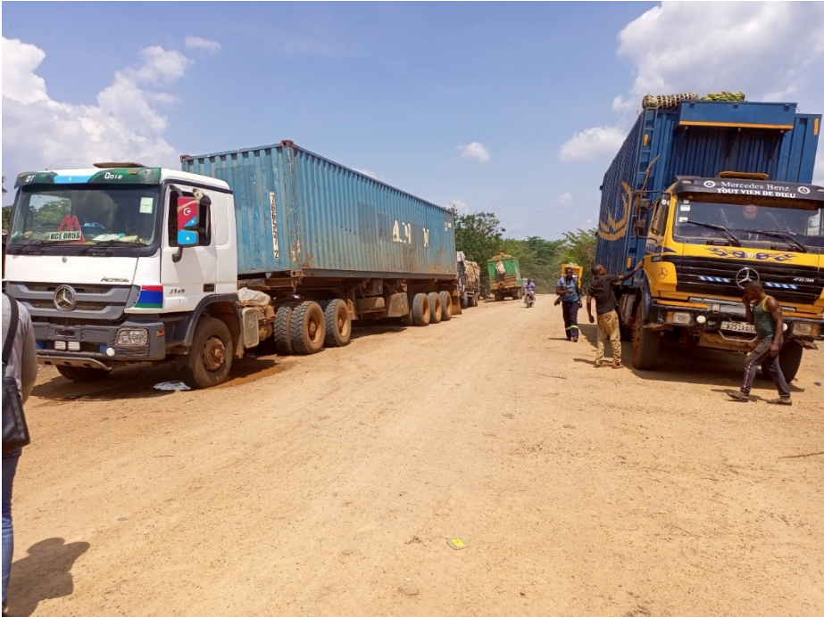
Image 9. Camions en partance vers la ville de Kisangani (ou de retour de la ville de Kisangani) en passant par Mambasa. Plus de la moitié des camions traversant cette route appartiennent aux commerçants Nande.