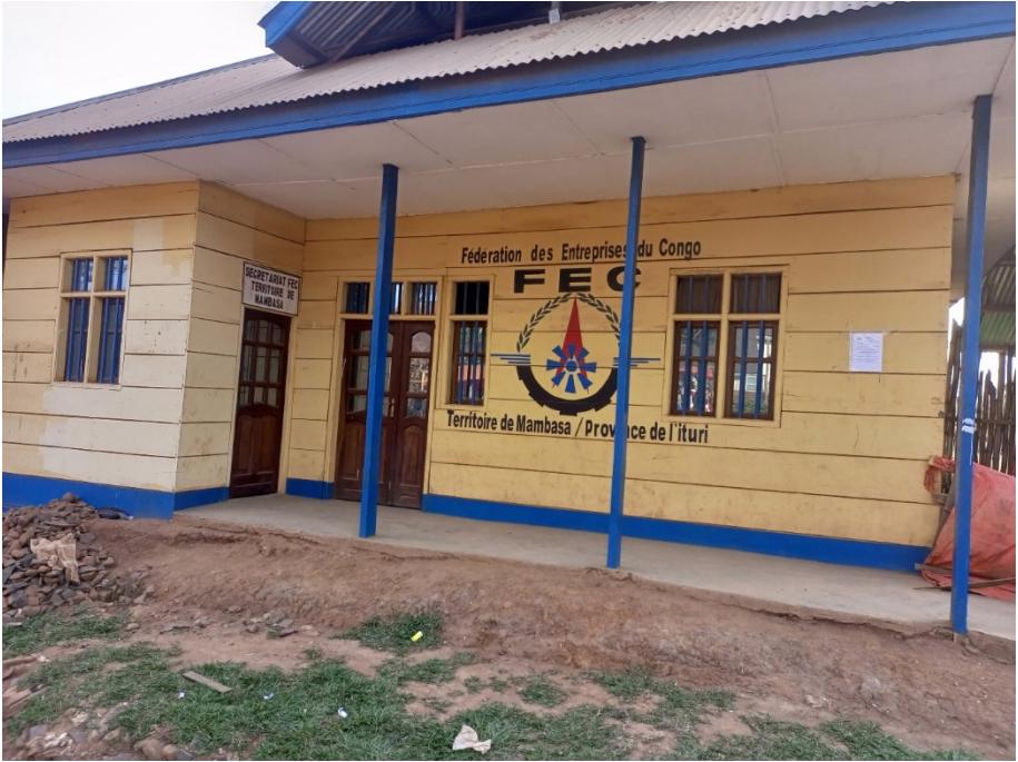
Image 10. Bureau de la Fédération des Entreprises du Congo/Territoire de Mambasa. Une structure dominée par des entrepreneurs Nande, sous la présidence d'un Nande (KAMBALE SYAHUSWA), Crédit Photo : Joël Baraka/Pole Institute.