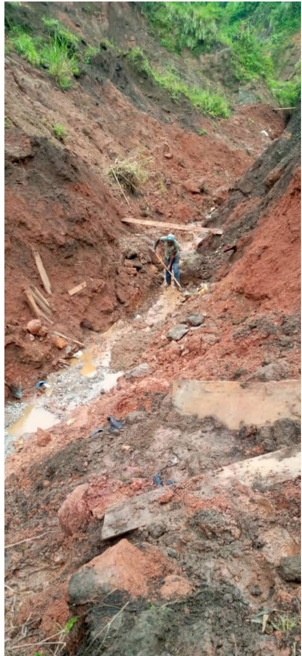
La mine de Muderu où plusieurs incidents ont été signalés.

La deuxième alerte de fraude a été relevée à Mishavu le 23 avril 2020. Il s'agissait, dans ce cas, des personnes qui faisaient passer, à Nyagisenyi, des minerais tirés du périmètre d'exploitation de la SMB vers celui de la SAKIMA. L'implication des deux sociétés n'a pas été établie mais grâce à des discussions avec des membres des communautés, nous avons appris que cette pratique n'était pas nouvelle. Elle serait même l'œuvre des femmes qui font passer, dans des paniers, les minerais (Cassitérite, Tourmaline, Manganèse) de Mishavu vers Nyagisenyi. Les acheteurs de ces minerais seraient déjà sur place lorsqu'elles arrivent, ce qui signifie que c'est un coup bien rodé. Les minerais sont alors directement chargés dans des véhicules pour aller vers le périmètre de SAKIMA où se trouvent aussi des creuseurs de la COOPERAMMA. Cet incident n'a pas été confirmé par les autorités que nous avons contactées mais il semble être une parade des creuseurs pour ne pas emmener les minerais dans les dépôts de la SMB.