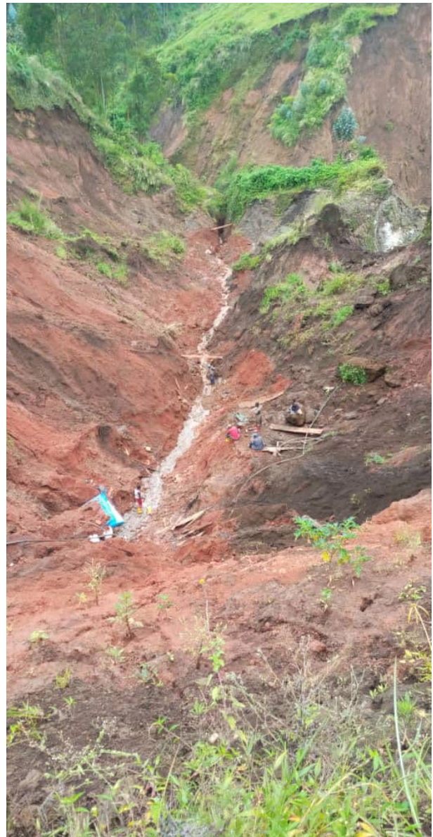
La mine de Muderu où plusieurs incidents ont été signalés

Le territoire de Masisi est aussi riche en minerais qui sont exploités, dans la plupart des cas, de manière artisanale à Rubaya et à Ngungu. Pendant plusieurs années, les sites d'extraction ont été les repères de divers groupes armés qui s'affrontaient pour s'assurer leur contrôle. A Pinga dans la partie ouest du territoire de Masisi, par exemple, le NDC/ Cheka a profité de l'exploitation des minerais (or, cassitérite) et du bois pour financer l'achat de matériels militaires et le paiement des combattants entre 2007 et 2013. Mais avec le rétablissement progressif de l'autorité de l'Etat (chassés par les FARDC, plusieurs miliciens ont adhéré au processus de désarmement, démobilisation et réintégration (DDR) et une bonne partie s'est reconvertie en artisans miniers) et l'entrée en vigueur de la loi Dodd-Frank qui décourage les entreprises américaines à acheter des minerais provenant des zones de guerre de la RDC, ces groupes armés se sont retirés au profit des sociétés minières plus crédibles ; c'est le cas de la Société Minière de Bisunzu à Rubaya.