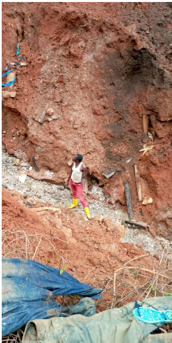
La mine de Muderu où plusieurs incidents ont été signalés.

Il n'a pas toujours été possible de résoudre des incidents violents, les enquêtes n'ayant pas permis d'identifier les auteurs de plusieurs crimes. La population de Rubaya a même manifesté dans la première quinzaine du mois de juin 2020 pour demander le remplacement des agents de police qui étaient épinglés dans plusieurs incidents sécuritaires. Le ministre provincial de l'intérieur s'était rendu sur place, accompagné de quelques députés provinciaux originaires de ce territoire, pour calmer la tension. Après plusieurs mois au cours desquels la population demandait la permutation de ces agents de police qui avaient passé plusieurs années à Rubaya, ils ont enfin été envoyés ailleurs. Ce n'est pas une garantie pour