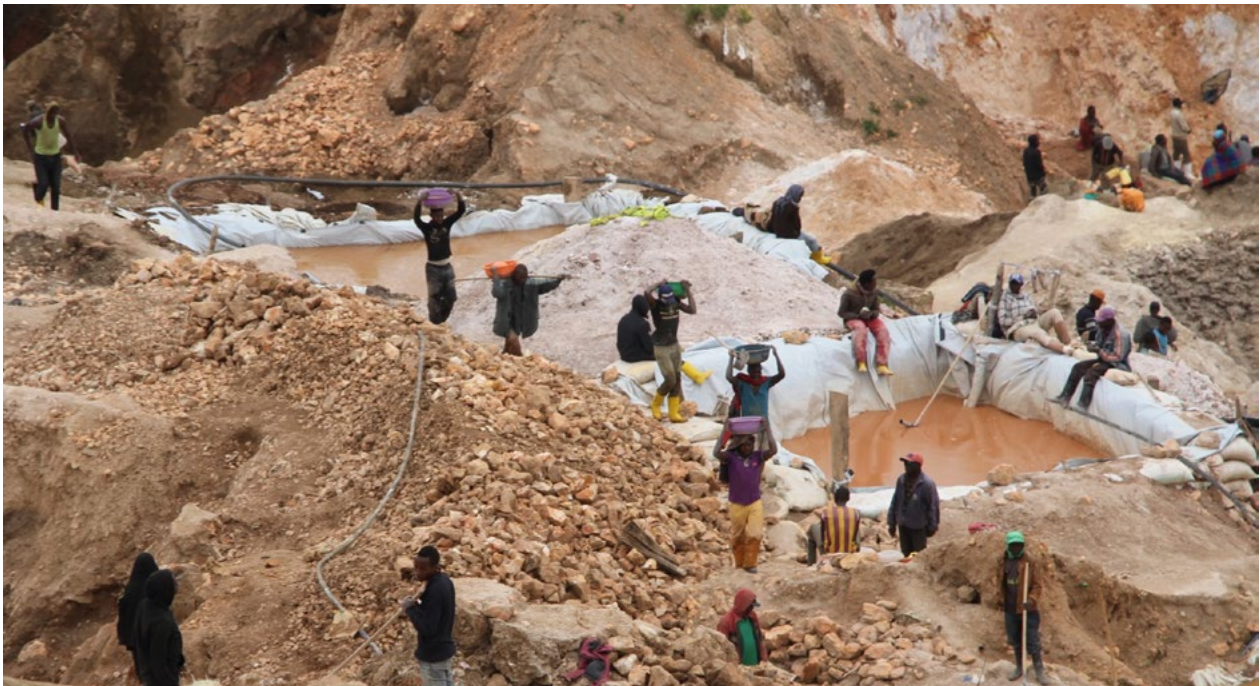
Une vue des laveries aménagées sur les sites d'extraction, en haut des collines.

Entre septembre 2019 et juin 2020, trois incidents, ayant trait au problème environnemental, ont été relevés sur la plateforme « Kufatilia ». Le premier a été recensé en novembre 2019 mais il n'a pas été confirmé par nos contacts sur terrain. Le deuxième incident est survenu en janvier 2020 à Bibatama, le lanceur d'alerte dénonçant le fait que les creuseurs endommagent des tuyaux de distribution d'eau pour utiliser cette eau dans le nettoyage des minerais. Pole Institute a contacté les autorités administratives de Rubaya pour les engager dans la résolution de l'incident, ce qui a abouti à la mise sur pied d'un comité d'eau pour procéder à la réparation des tuyaux endommagés. Plusieurs personnes se plaignaient de manquer d'eau potable ou de se retrouver parfois avec de l'eau salie, impropre à la consommation. Toutefois, les auteurs de cette pratique n'ont pas été identifiés. Le troisième cas de problème environnemental faisait état de l'utilisation du mercure dans une rivière. Pas assez détaillé, il n'a été confirmé par aucun acteur contacté par Pole Institute à Rubaya.