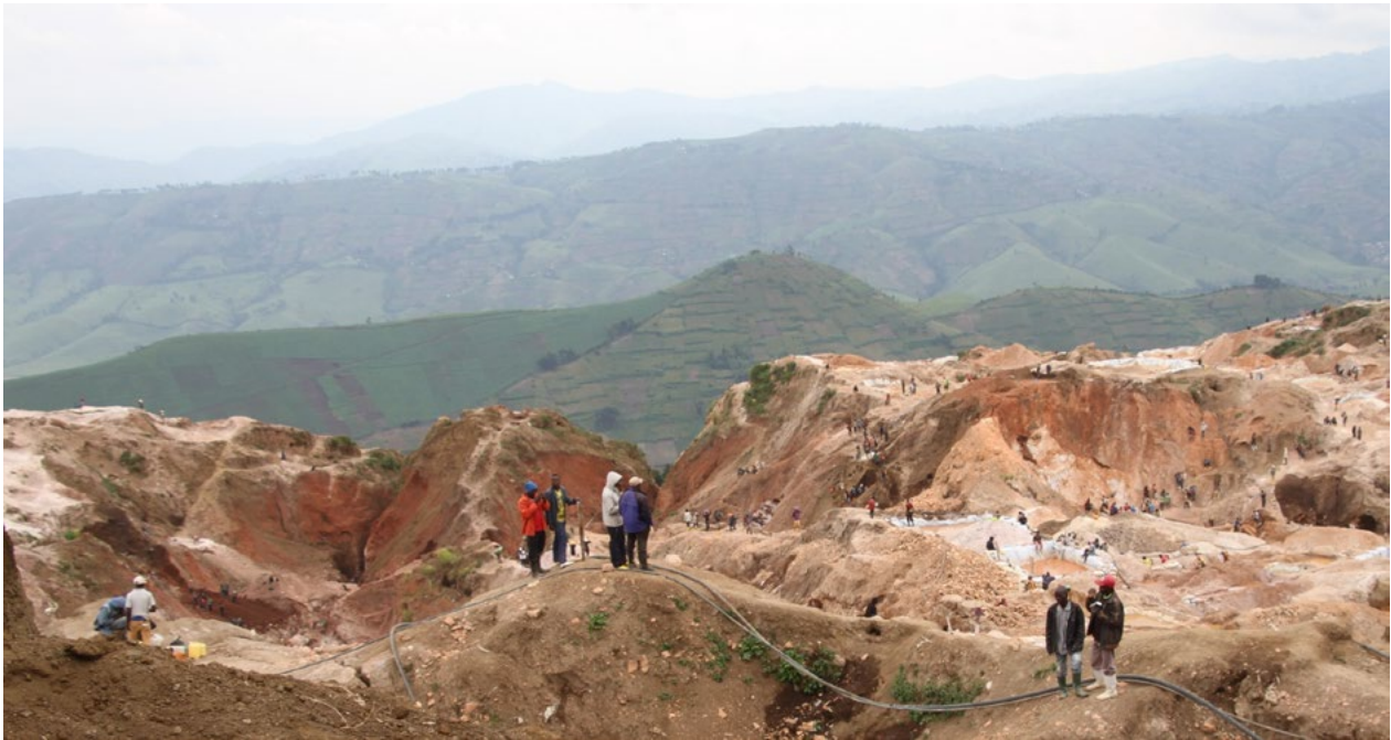
Une vue du site de Luwovo.