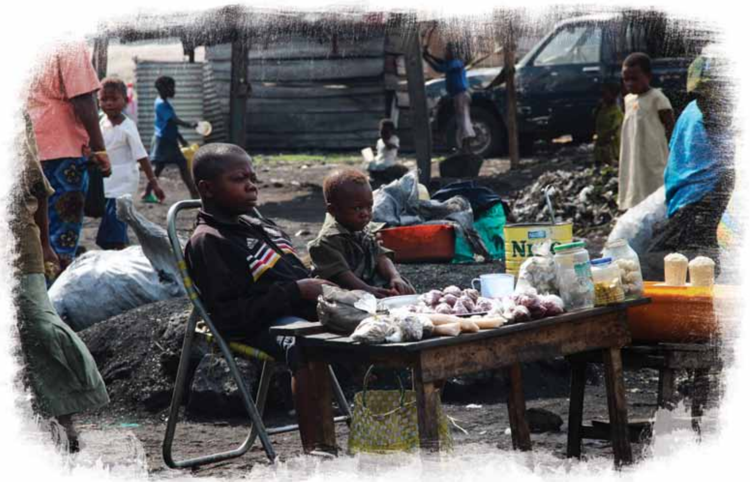
Le maigre salaire des militaires ne leur permet pas toujours de scolariser leurs enfants et ceux-ci sont mis à contribution pour faire vivre la famille.

9. Ces problèmes sont tout autant imputables aux échecs répétés de la RSS qu'ils en sont la cause. Ils ne permettent en aucun cas d'ignorer le besoin d'une RSS. Il n'en demeure pas moins que le gouvernement congolais s'est sans cesse abstenu d'offrir un soutien politique suffisant à un changement digne de ce nom. Surtout, il n'a pris aucune mesure pour mettre un terme à la corruption endémique, au manque de discipline et à la faiblesse des structures de commandement qui nuisent aux efforts de réforme dans le secteur de la sécurité. Malgré la déclaration à fort retentissement du Président Kabila en juillet 2009, annonçant une « tolérance zéro » à l'égard de la violence sexuelle et de la corruption, la situation sur le terrain n'a que trop peu évolué. Le soutien accordé à la justice, aux enquêtes et à la lutte contre la corruption est minime et manifestement inadéquat – le ministère de la Justice s'est ainsi vu attribuer seulement 0,1 % des dépenses gouvernementales en 2011 39 , et son budget aurait chuté de 47 % de 2007 à 2009. 40 De nombreux individus qui occupent un poste à responsabilité au sein du gouvernement ou de l'armée continuent de profiter de la corruption, que ce soit en se servant sur les salaires, en prélevant des pots-de-vin, en prenant part à l'exploitation ou au commerce illégal des minerais, ou encore en rackettant les gens en échange d'une protection.