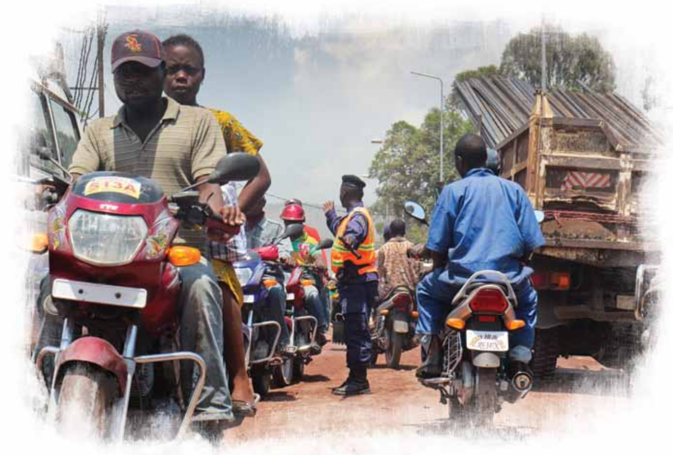
Une patrouille de la police congolaise dans les rues de Goma.

18. Ce contexte a entraîné le lancement d'initiatives bilatérales décousues dans les domaines de la formation, de la sensibilisation, de la réhabilitation de l'infrastructure ou du renforcement des capacités. Quelques réussites ont été constatées en matière de RSS, notamment dans les domaines de la police, de la justice 59 et au niveau de certaines unités militaires, même si nombre d'entre elles ont été de courte durée en raison d'un manque de soutien – locaux, équipements et salaires – ou de l'éclatement des unités. Certaines propositions de formation n'ont reçu aucune demande, laissant inactifs les centres et leurs formateurs. La MONUSCO 60 et l'EUSEC, une mission de l'Union européenne lancée en 2005, ont tenté à plusieurs reprises d'aborder les problèmes structurels au sein des FARDC. Faisant intervenir un petit nombre de fonctionnaires européens, l'EUSEC a connu un certain succès avec son projet de « chaîne de paiement » – en veillant à ce que tous les soldats touchent leur salaire – et dans l'organisation d'un recensement du personnel des FARDC, ainsi que dans le domaine de la réforme administrative 61 . Bien que ces initiatives aient été utiles, elles ne sont pas suffisantes pour entraîner un changement systémique.