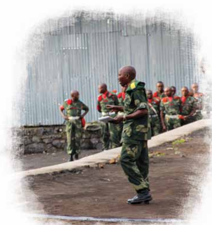
Un commandant passe ses troupes en revue. Le non-respect des structures de commandement militaire fait partie du quotidien de l'armée.

15. Par ailleurs, loin de pouvoir être qualifiée de pays « post-conflit », la RDC a continué de subir des accès de violence extrêmement graves. Durant la période qui a suivi les élections de 2006, des vagues soudaines et successives de conflits ou de tensions régionales ont conduit la communauté internationale à tenter de résoudre des crises politiques de courte durée ou