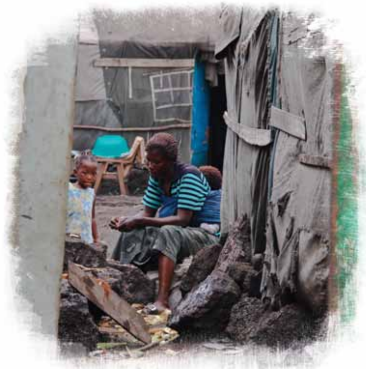
Une famille de militaire vivant au camp Katindo, dans le Nord Kivu. Le camp a des allures de bidonville et la plupart des familles vivent dans des tentes de réfugiés.

28. Il incombe à la communauté internationale de reconnaître cet impératif. Il lui faut également agir. Tous les autres objectifs – humanitaires, économiques, sécuritaires ou de développement – seront difficiles voire impossibles à atteindre sans RSS concertée. Les partenaires externes de la RDC doivent prendre une position collective sur une réforme sérieuse du secteur de la sécurité, tant pour générer une volonté politique que pour soutenir les processus de réforme congolais qui en découleront. Le gouvernement congolais bénéficie depuis la fin de la guerre d'un soutien financier et diplomatique significatif. Il convient aujourd'hui de tirer parti de tous ces engagements.